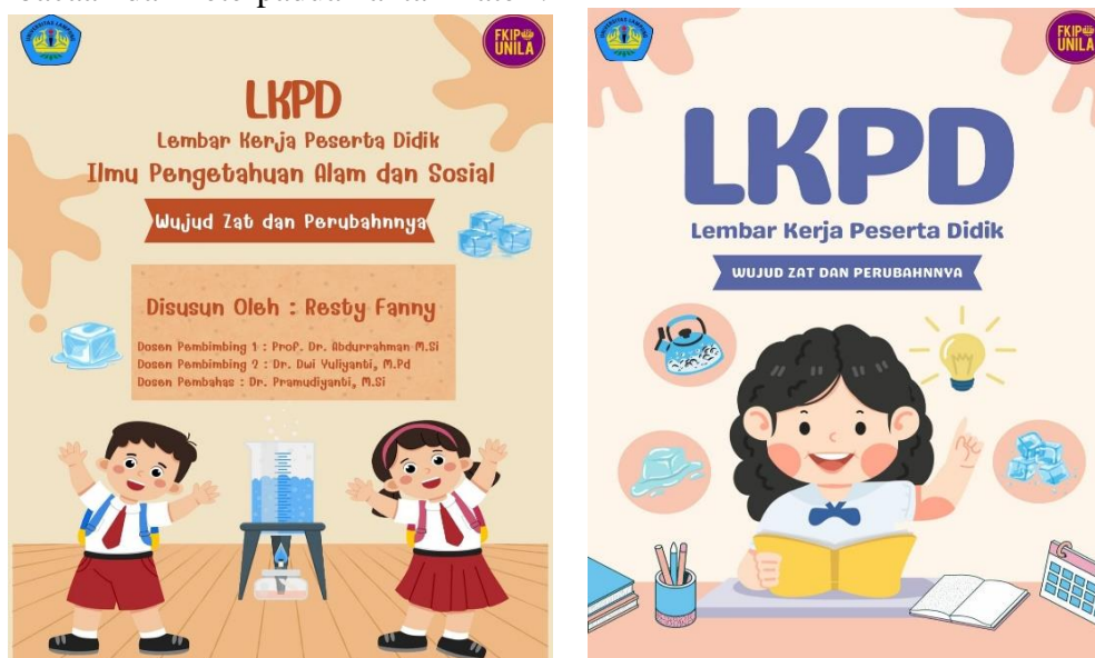
Gambar 2. Desain LKPD IPAS Dengan Prinsip Deep Learning Terintegrasi STEAM

Tahap desain menghasilkan rancangan LKPD dengan struktur yang memadukan prinsip Deep Learning dan integrasi STEAM. Aktivitas yang disusun menekankan keterlibatan siswa dalam mengamati fenomena, merancang solusi, dan melakukan refleksi. Tampilan LKPD dibuat menarik dengan ilustrasi dan konteks kehidupan nyata sehingga sesuai dengan karakteristik siswa sekolah dasar. Desain ini mendapat masukan dari ahli untuk memperkuat aspek keterbacaan dan keterpaduan antar materi.