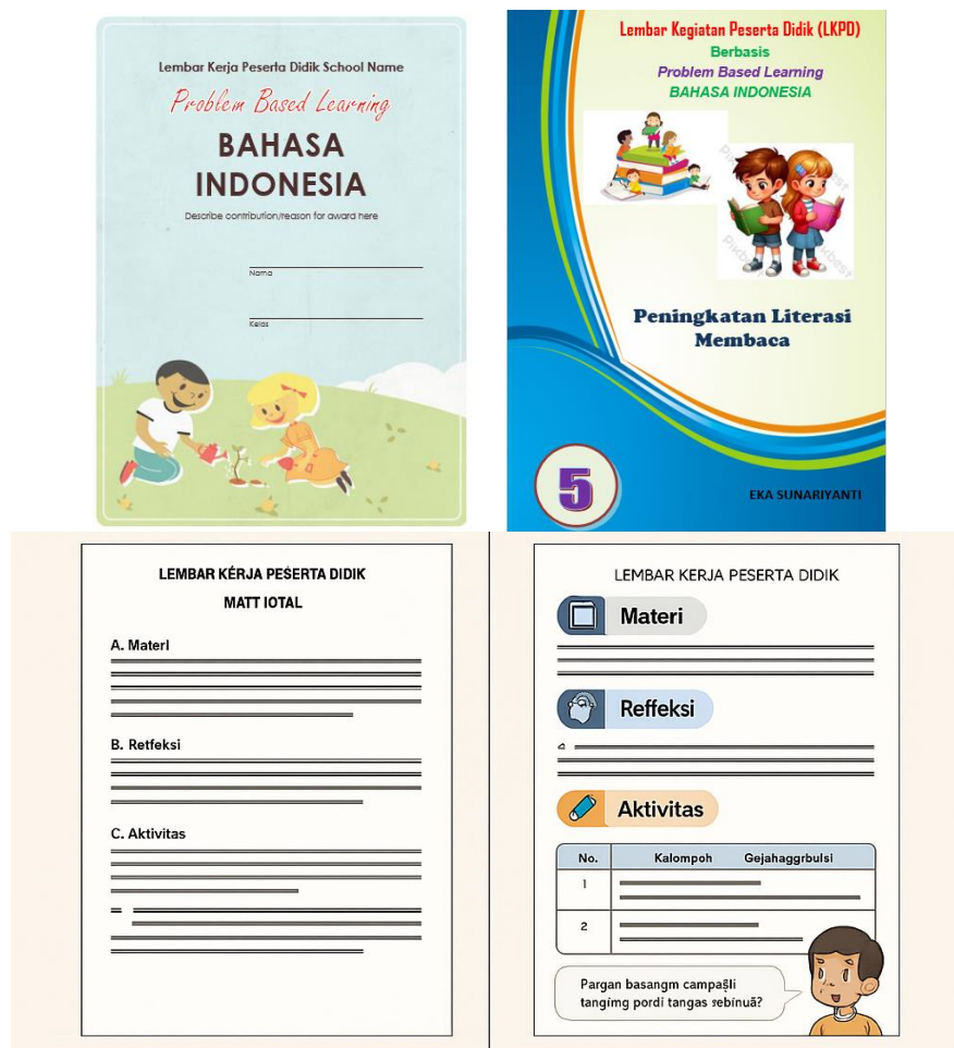
Gambar 2. LKPD Sebelum dan Sesudah Validasi Ahli

Setelah dilakukan validasi, para ahli memberikan sejumlah catatan perbaikan yang menjadi dasar revisi desain dan isi LKPD. Ahli desain menyarankan perbaikan struktur tata letak, pemanfaatan warna secara proporsional, serta penambahan ilustrasi dan ikon edukatif untuk memperjelas aktivitas belajar. Ahli bahasa menekankan pentingnya penggunaan kalimat yang lugas, komunikatif, serta sesuai dengan tingkat perkembangan kognitif siswa kelas V, termasuk penyusunan instruksi yang lebih jelas dan tidak membingungkan. Hasil revisi menunjukkan peningkatan signifikan pada kualitas visual, keterpaduan isi, dan keterbacaan teks LKPD, sehingga secara keseluruhan produk menjadi lebih menarik, mudah digunakan, dan mendukung pembelajaran aktif berbasis PBL.